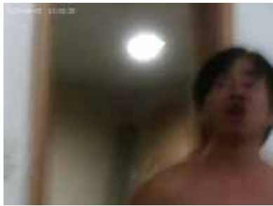
圖 2. 2013.8.02 13:02:46 到兇手追殺到門口才 21 秒