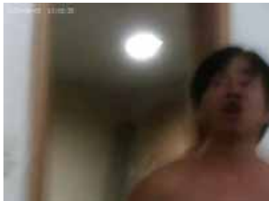
圖 2. 2013.8.02 13:02:46 到兇手追殺到門口才 21 秒