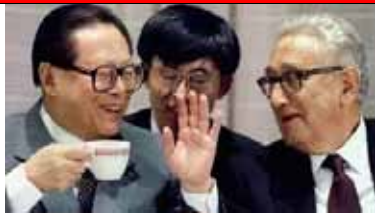
早前的江澤民-基辛格

基辛格於2014年4月8日在美國亞洲協會政策研究所成立儀式上避無可避、忍不住口地說：“江澤民在就任之初被外界大大低估了...”！到底他的“什麼能力”被低估了什麼？