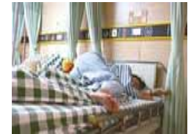
小学生不交作业暴打老师