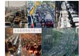
全球最拥堵城市排行榜