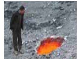
建筑工地旁的“火山口”