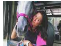
富家女不开心跳楼自杀