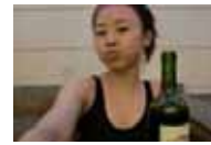
被包养遭抛弃女主播私照