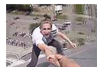
俄两男子楼顶危险表演