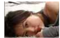
三线女星豪门隐秘生活