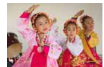
镜头记录真实朝鲜