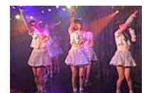
揭日本高中女生黑暗面