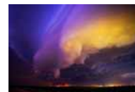
摄影师捕捉风暴绝美照片