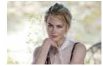
沙漠女王 妮可·基德曼狂

李楠之子身高预计能达2米16 苦练基本功未来可期 幻灭!韩国48岁健身女皇“秒变”臃肿大妈 全面二孩政策最快年内实行 后续新进展将公布 惊呆了!避孕套曾经是处方药 裙子凉鞋 斐济男人正装标配(图)