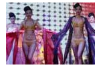
郑州黄金内衣秀现场曝光