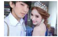
泰国征兵现场靓丽“人妖”