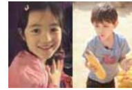
揭明星们的混血萌娃